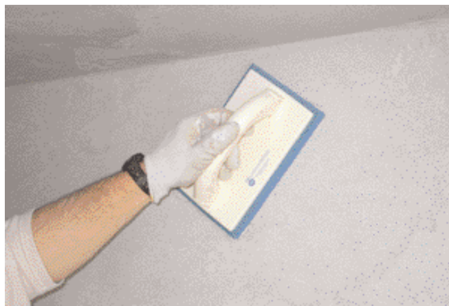
Mistral di 3M Srl Lavorazione Gommaspugna all'opera.