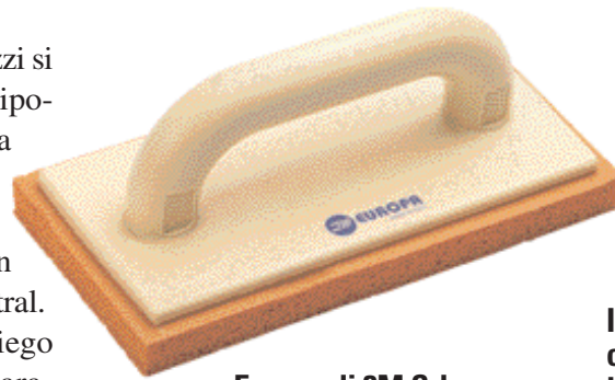
Europa di 3M Srl Lavorazione Gommaspugna.

I due modelli di frattazzi si differenziano per la tipologia di gommaspugna che montano e per la forma dell'impugnatura, più arrotondata in Europa rispetto a Mistral . Le differenze di impiego dipendono da due parametri: la durezza della