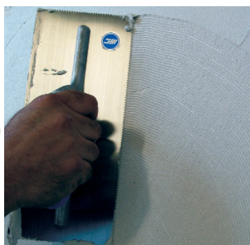
▲ Frattoni per mosaico.

La particolare dentatura distribuisce la giusta quantità di colla per una posa ottimale senza alcuna fuoriuscita sul fronte del mosaico